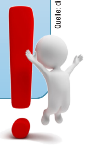
Abb. 2: Übersicht über die Änderungen im B3S WA, Version 2021

zu ermitteln. Hierzu bietet der B3S WA 2021 den Betreibern bei der Bestimmung der notwendigen durchzuführenden Maßnahmen auch dann eine geeignete Arbeitshilfe, wenn es (noch) keine Umsetzungshinweise seitens des BSI gibt. Sofern die Anforderungsbeschreibung (BSI IT-Grundschutz-Kompendium) nicht selbsterklärend ist, wurden Referenzen auf die in den IT-Grundschutzkatalogen beschriebenen Maßnahmen aufgenommen (15. Ergänzungslieferung, Stand 2016; letzte vom BSI herausgegebene, aktualisierte Fassung). Diese entsprechen den in den vorhergehenden Versionen des B3S WA aufgeführten Maßnahmen.