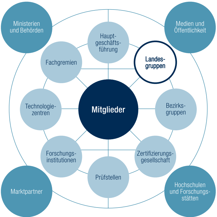
Das Netzwerk des DVGW – auf nationaler und internationaler Ebene

in das Netz ein. Sie organisieren den Erfahrungsaustausch zwischen den Mitgliedern, den Behörden, dem Marktpartnern und öffentlichen Institutionen.